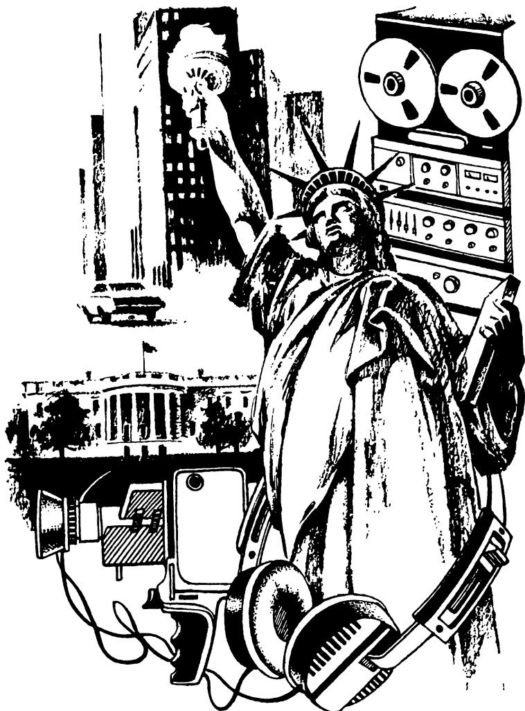
Рисунки Владимира Родина.

шпионского ведомства Ричарда Хелмса и доложил ему об аресте «команды Белого дома».