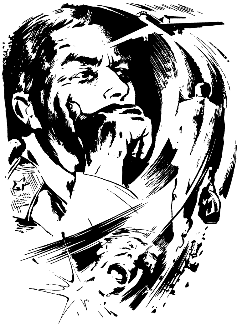
Рисунки Олега Вуколова