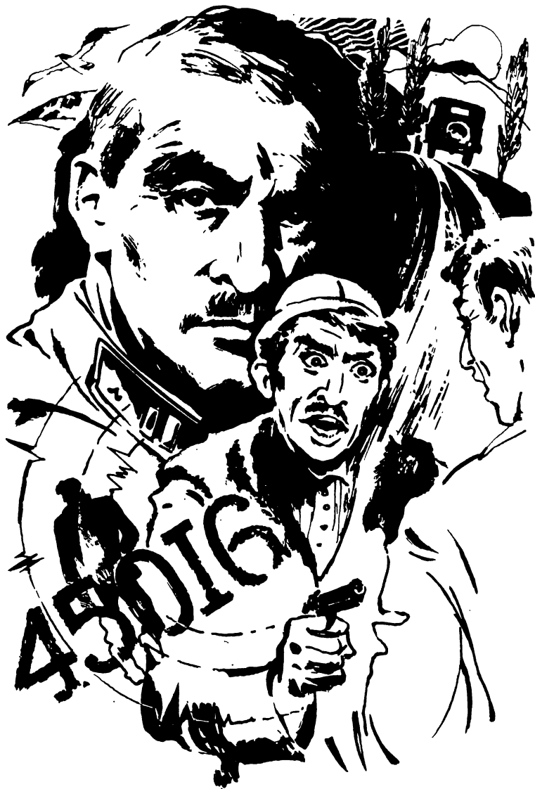
Рисунок Олега Вуколова

«Приземлились хорошо разошлись намеченным пунктам 45016 готовит взрыв шахты связь через пять дней это время Гиви».